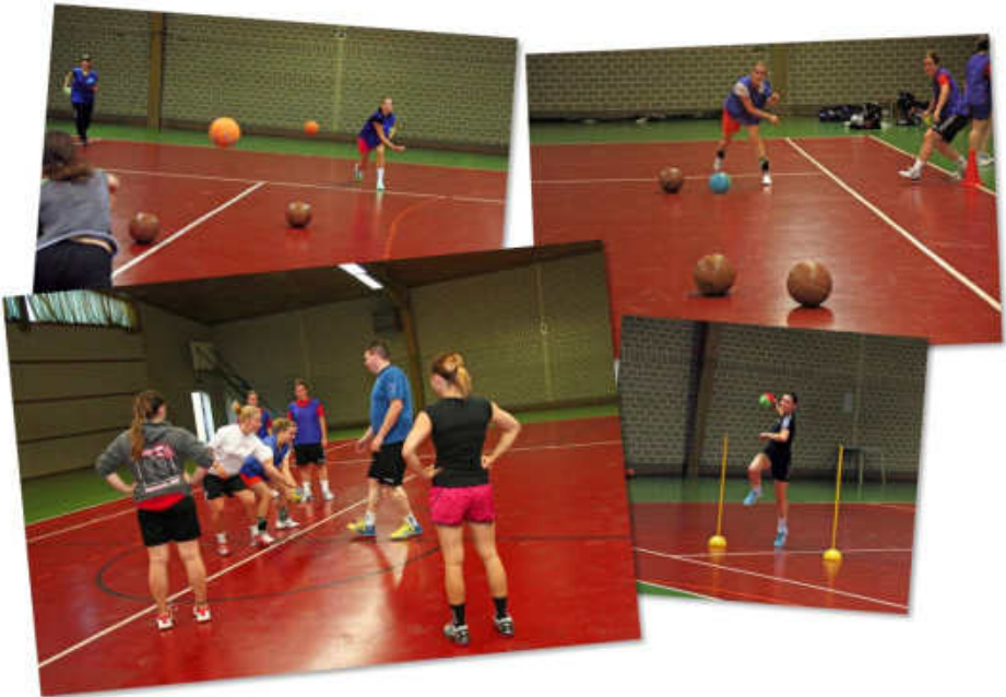
Trainingsimpressionen aus der Vorbereitung.