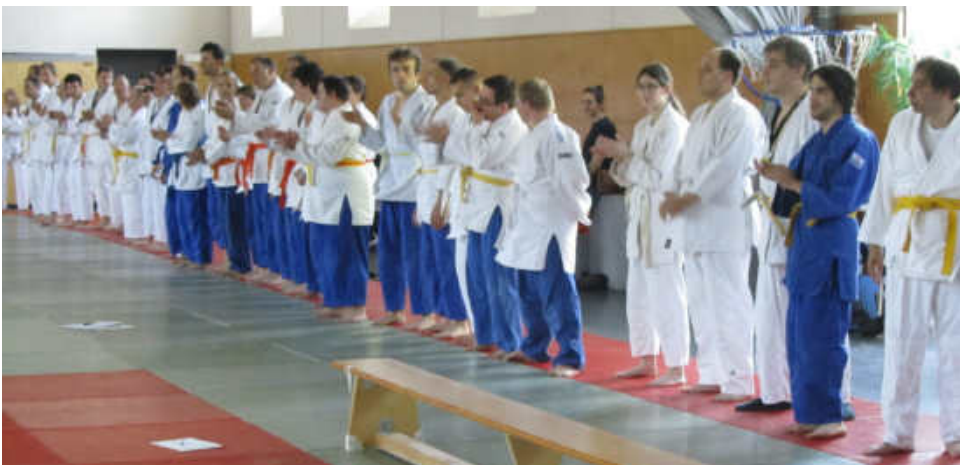
Begrüßung der teilnehmenden Sportler