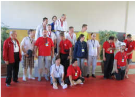
Das erfolgreiche Team