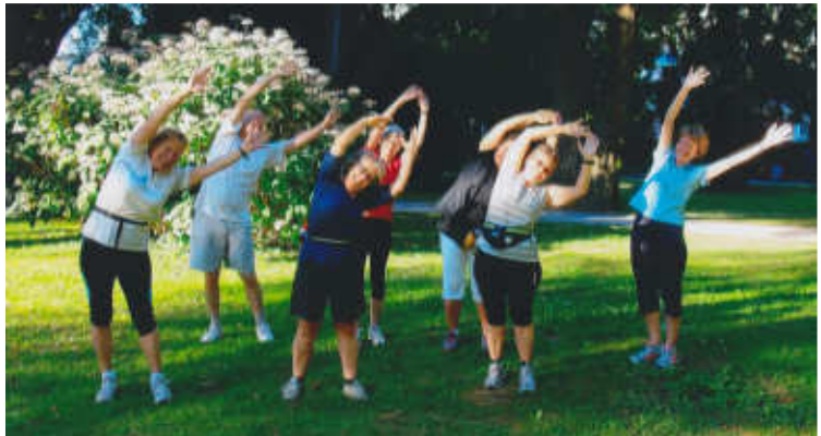
Nach dem Laufen sind Dehn- und Lockerungsübungen angesagt

Dann schaut doch mal donnerstags am Morgen bei der Weiherhofhalle vorbei!