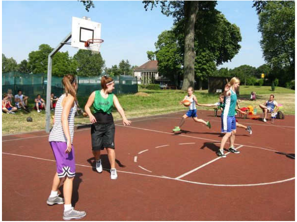
Grill & Chill: Streetballturnier auf der Unteren Hub mit ausgedehnter Grillpause

Und nun steht kurz vor Feriende die neue Saison bedrohlich nah vor der Tür. Am 28. September fällt der Startschuss für Herren II und U15-Oberliga und in der kurzen Phase zuvor