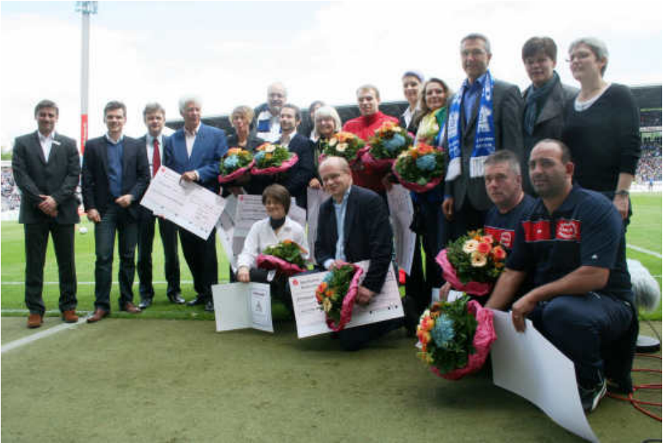
PREISE FÜR INKLUSION IM SPORT: Im Wildpark erhielten Vereine und Aktive Auszeichnungen für ihr Engagement in Sachen Teilhabe von Menschen mit Behinderung.