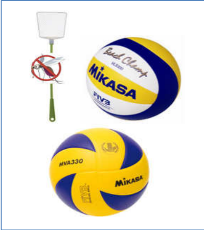
Die Hallensaison bricht an. Die Sommer-sportgeräte werden gegen das Winter-sportgerät (unten) getauscht.

Die Beachvolleyballsaison neigt sich dem Ende zu. Nachdem der Sommer sich in diesem Jahr zunächst durchaus hat bitten lassen, hat man die vergangene Hitzeperiode rege dazu genutzt, öfters mal im Sand zu schwitzen. Beachvolleyball – da sind sich alle einig – macht einfach Spaß. Da hat manch einer sogar gerne mal auf das kühle Nass im Freibad oder am Baggersee verzichtet.