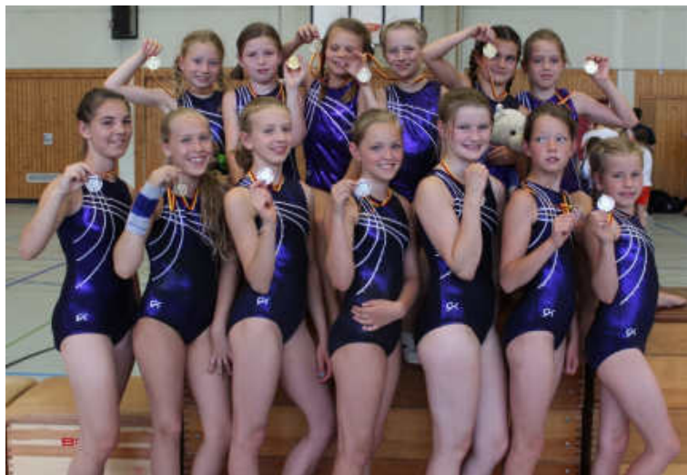
DIE TURNERIN- NEN DER TSD beim Wettkampf der Gauliga KM IV.

Am Samstag, den 11. Mai und am 22. Juni 2013 turnte die Turnerschaft Durlach bei einem Gauliga-KM-IV-Wettkampf in Karlsruhe mit.