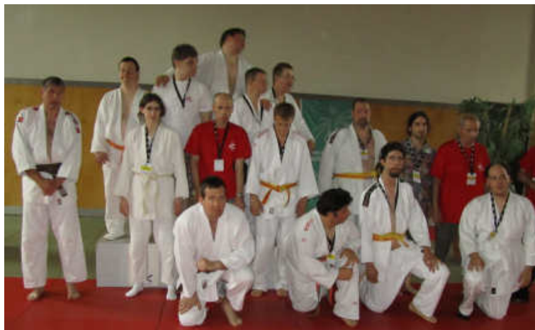
DAS TEAM DER DURLACH MATTENFEGER bei den regio- nalen Spielen für Baden-Württem- berg in Karls- ruhe