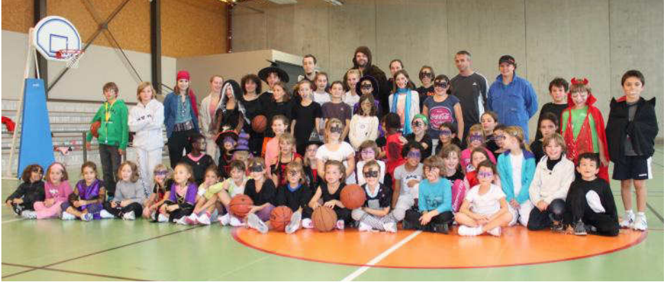
Jedes Jahr organisiert Dynamic Basket für die Jugend ein Halloween-Turnier. Viele kommen im passenden Kostüm.

Über das Jahr verteilt organisiert Dynamic Basket Lot Corrèze die verschiedensten Festivitäten. Im Oktober gibt es für die Jüngeren ein Halloween-Turnier, natürlich im passenden Kostüm. Und zusätzlich werden die Pasteten für das „Randonnée Gourmande“ im Frühling vorbereitet. Das „Randonnée Gourmande“ ist eine Wanderung mit mehreren Stationen, an denen man nacheinander Vorspeise, Hauptgang, Käse und Nachtisch einnimmt.