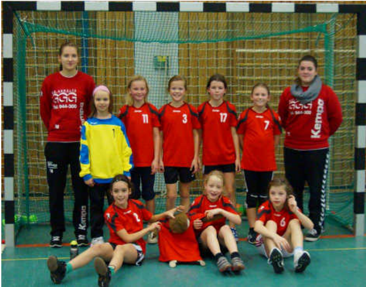
Weibliche E-Jugend der Turnerschaft Durlach (Saison 2013/14)

Erfolgreicher Saisonstart der weiblichen E-Jugend in die Saison 2013/14