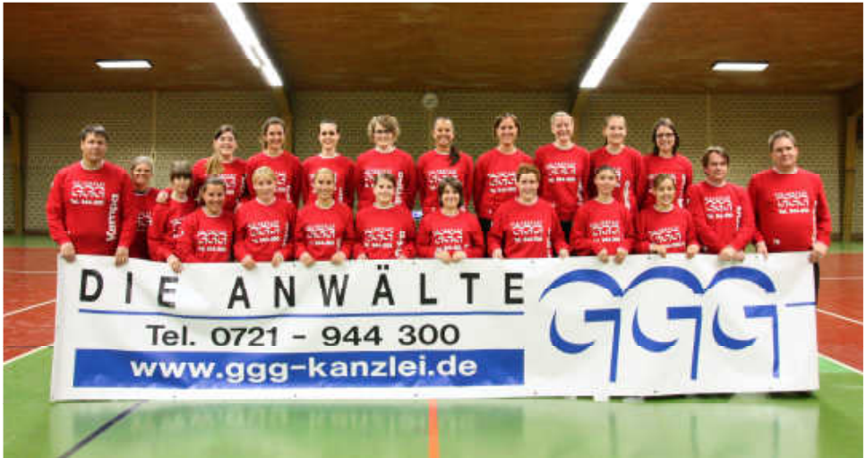
Damenmannschaft in der Saison 2013/14

Verpatzter Saisonstart lässt die Ziele in weite Ferne schwinden