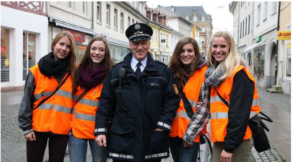
Auch die Polizei – hier mit Streckenposten von der Basketball-Abteilung – freute sich über den reibungslosen Verlauf der Veranstaltung ohne Zwischenfälle.