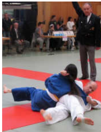
Freude über gutes Abschneiden bei den Badischen Meisterschaften in Elchesheim-Illingen: die Durlach Mattenfeger.

Gut gelaunt reisten die zehn Athleten der Durlach Mattenfeger mit ihren Trainern Manfred Nowotny und Torsten Rühl am Samstag, den 12.10.2013 zu den „Offenen badischen Landesmeisterschaften für Judo mit geistiger und körperlicher Behinderung“ nach Elchesheim-Illingen.