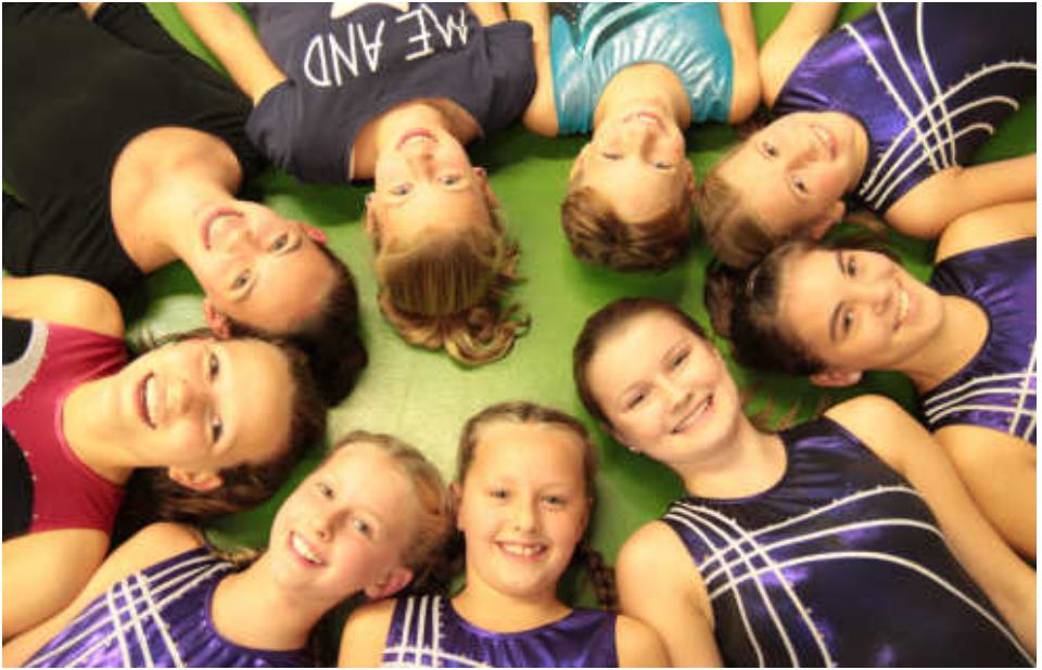
Ungewohnte Perspektive: Teilnehmerinnen an den Einzelwettkämpfen der Pflichtübungen.

Die Turn-Herbstwettkämpfe haben begonnen: Am Samstag, den 12.10.2013, fanden in Malsch die P-Einzelwettkämpfe statt. „P“ steht für Pflichtübungen. Diese sind im Aufgabenbuch des Deutschen Turnerbundes festgeschrieben und in verschiedene Schwierigkeitsstufen von 1 (leicht) bis 10 (schwer) unterteilt.