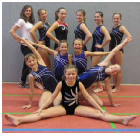
Die Turnerinnen beim Kür-Wettkampf.

Der letzte Wettkampf des Jahres fand am 9.11.2013 in der neuen Sporthalle des TV Knielingen statt.