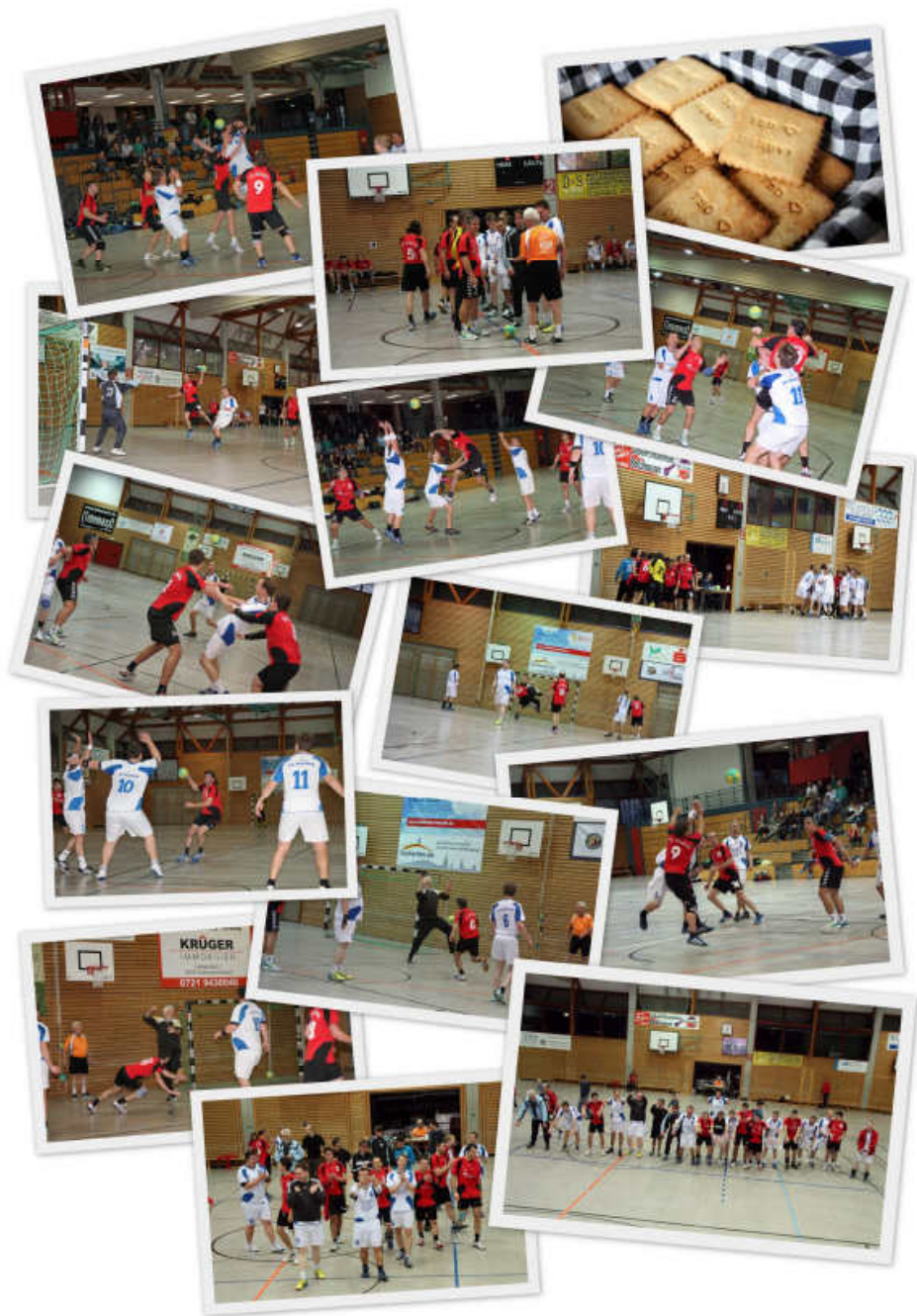
HANDBALL-SPEKTAKEL: Jede Menge an gelungenen Aktionen boten die dritte (weiße Trikots) und die vierte Mannschaft (rote Trikots) der Turnerschaft den Fans beim Bruderduell in der Weiherhofhalle.