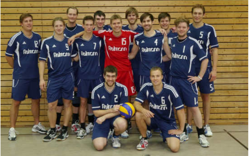
Die neu formierte Herren 1.

Seit Oktober diesen Jahres kämpfen beide Herrenteams aus Durlach wieder um Punkte in ihrer jeweiligen Liga.