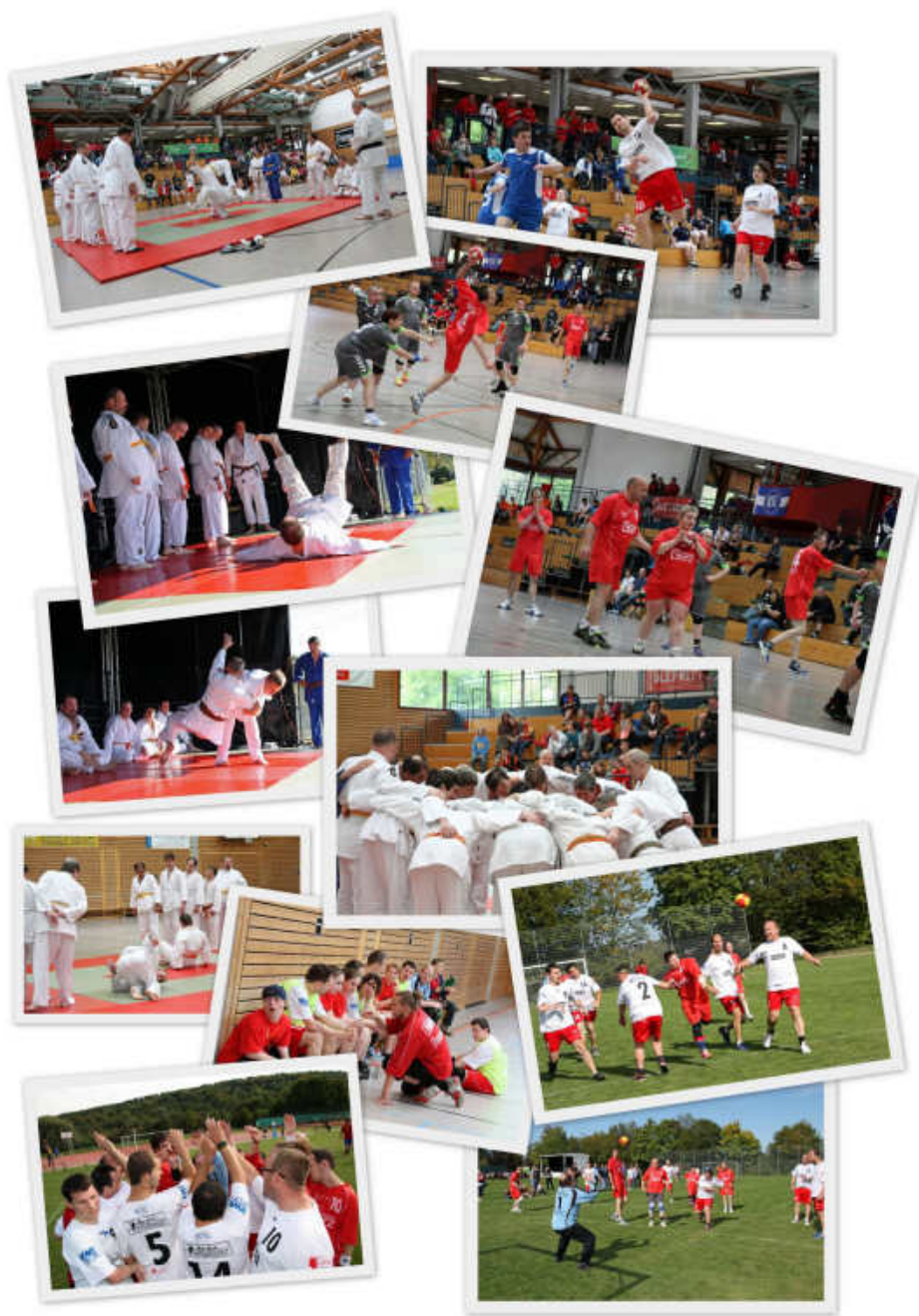
FEST DES INKLUSIVEN SPORTS: Die „Durlach Turnados“ wollen mit den „Mattenfegern“ und den Tischtennisspielern der Turnerschaft die Nationalen Spiele in Düsseldorf zum „Heimspiel“ werden lassen.