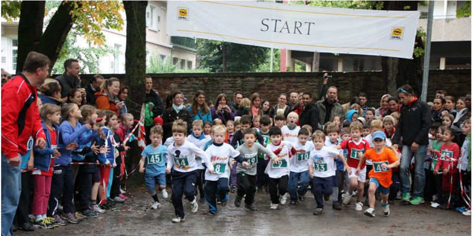
Mit Eifer bei der Sache: Das Laufereignis begann am frühen Nachmittag beim Kinderlauf mit den Bambini-Gruppen.

Die ersten Laufentscheidungen fielen zuvor im Durlacher Schlossgarten. Dort liefen etwa 200 Kinder in verschiedenen Altersgruppen zwischen 5 und 13 Jahren eine oder zwei Runden von je 400 Meter. Wie immer wurde mit großer Begeisterung um die besten Plätze gekämpft; als Belohnung gab es wieder für jedes Kind im Ziel eine echte Medaille.