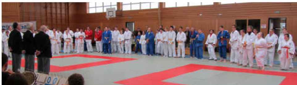
Gespannt warten die Mannschaften auf den Beginn der Wettkämpfe.