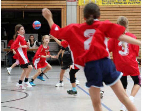
Freude am Handball zeigen die Mädchen der E-Jugend in dieser Saison – und das auch noch sehr erfolgreich!