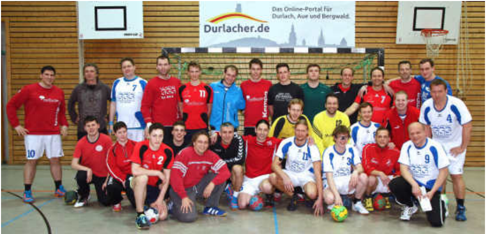
HANDBALL IST TOLL IN DER TURNERSCHAFT: Vor dem Bruderduell in der Kreisliga versammelten sich die Teams der Dritten und der Vierten zum Gruppenbild.