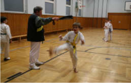
Übung mit der Pratte