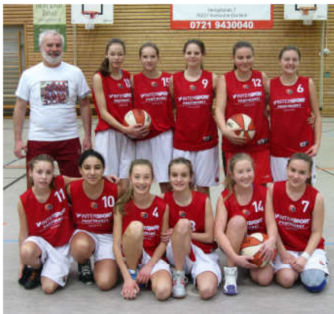
Die U15 weiblich I hat in der Jugendoberliga ihr Saisonziel erreicht.

Die U14 männlich hat sich in der Bezirksliga recht überraschend frühzeitig auf dem zweiten Tabellenplatz festgesetzt und wird am 5./6. April in Rastatt am Endturnier zur Bezirksmeisterschaft teilnehmen.