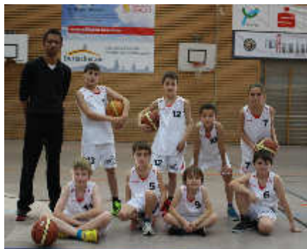
Turniersieger SSC Karlsruhe