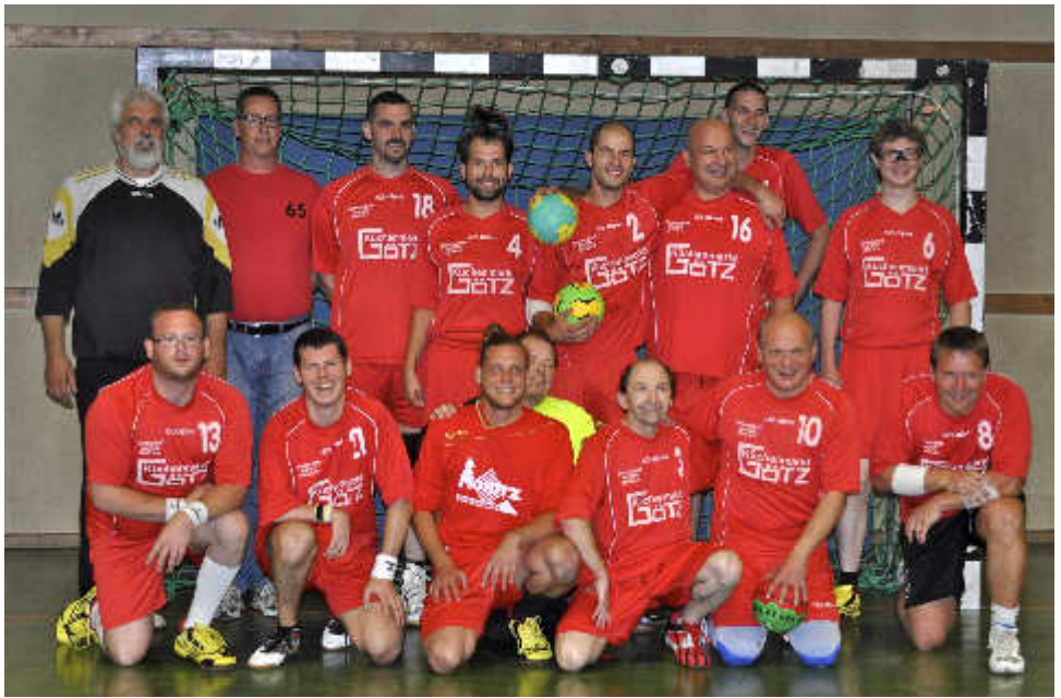
INKLUSIVES VORZEIGETEAM: Als erste Mannschaft aus Spielern mit und ohne Handicap im gesamten süddeutschen Raum nimmt TS Durlach 5 am regulären Spielbetrieb des Handballkreises Karlsruhe teil.