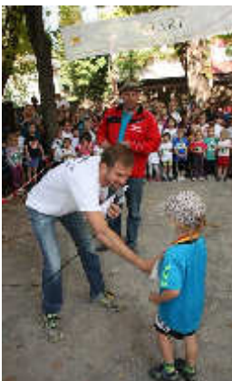
Gratulation an den Sieger bei den Bambinis