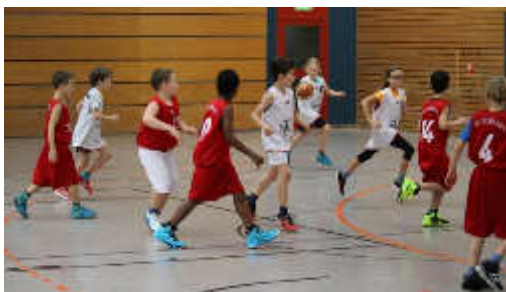
Voll bei der Sache