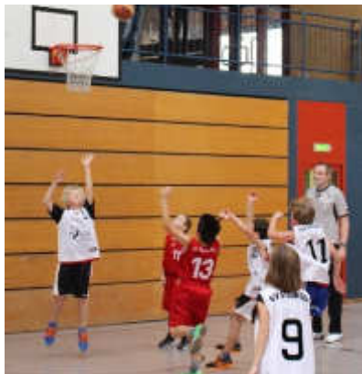
Ab in den Korb!