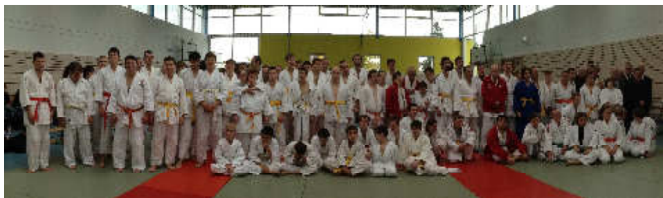
Teilnehmer der 15. BW-Meisterschaften.

Tolle Wettkampfstimmung, tolle Leute und ein hochwertiger Rahmen waren verantwortlich für das Gelingen der inzwischen 15. offenen baden württembergischen Einzelmeisterschaften im G-Judo am 11. Oktober 2014 in Au am Rhein, wobei das „G“ für das im Niederländischen geprägte „gehandicapt“ steht und die Mitwirkung von Menschen mit körperlichen und geistigen Behinderungen erklärt.