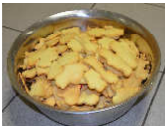
HANDARBEIT MAL ANDERS: Weihnachtsgutsle-Backen des Fördervereins Handball gemeinsam mit Kindern der Minis/E-Jugend.