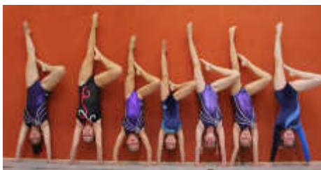
Die Turnerinnen stehen Kopf.