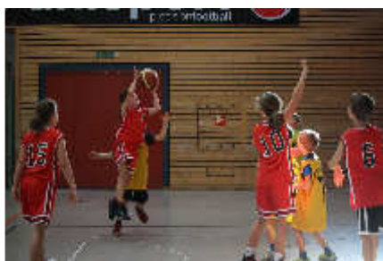
Kelterner Mädchen in Aktion