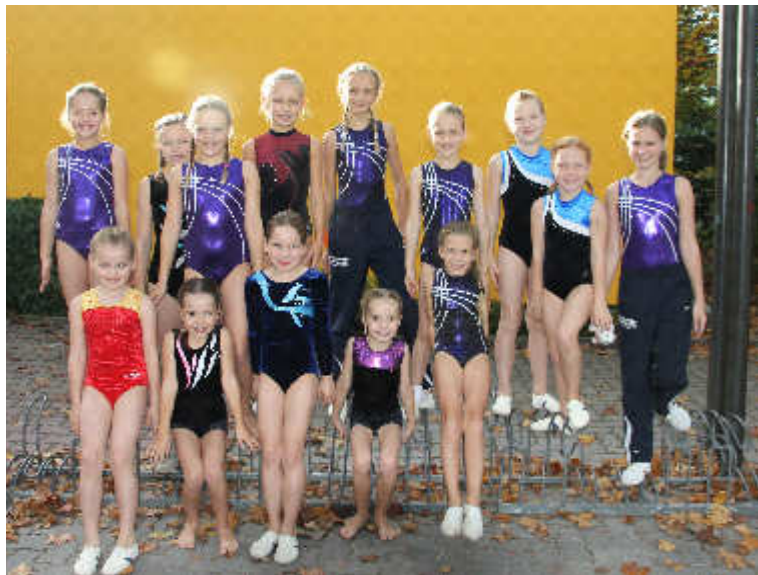
Die jüngsten Turnerinnen strahlen mit der Sonne um die Wette.

Am Samstag, den 18. Oktober 2014 hieß es für die Leistungsriege Turnen wieder: Ab zum Wettkampf! 22 Turnerinnen starteten in 2 Durchgängen und 7 Altersklassen im P-Stufen-Einzelwettkampf in Friedrichstal.