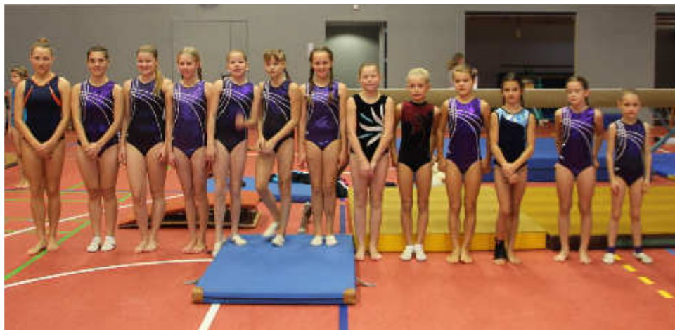
Angetreten zum letzten Wettkampf des Jahres!

Am Samstag, den 8.11. fand der letzte Wettkampf des Karlsruher Turngaus im Jahr 2014 statt. In Knielingen wurden die Gaumeisterschaften Einzel im Kürmodifizierten Modus ausgetragen. Kürmodifiziert bedeutet, dass sich jede Turnerin an den vier Geräten eine Übung ihres Könnens entsprechend zusammenstellen darf, die dann von den Kampfrichtern bewertet wird.