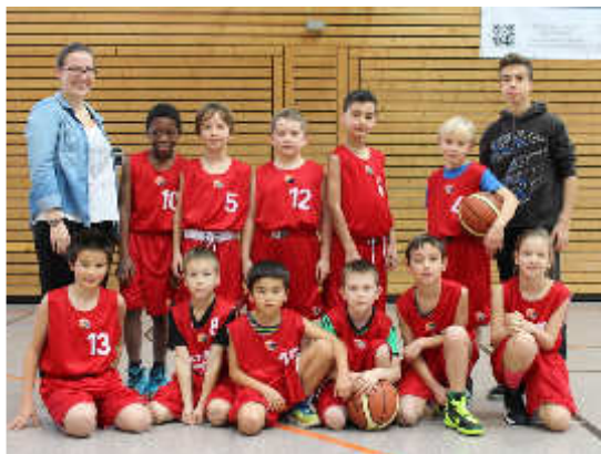
U10 der Turnerschaft