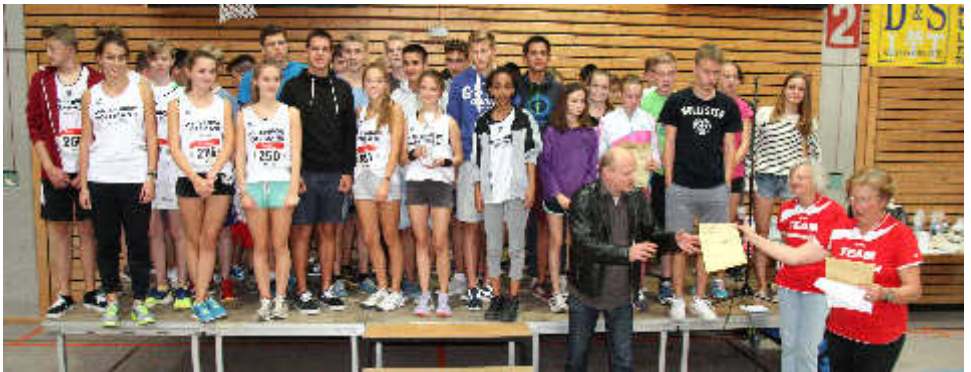
Das Markgrafen-Gymnasium gewann wieder einmal die Schulmeisterschaft gemessen an der Teilnehmerzahl.