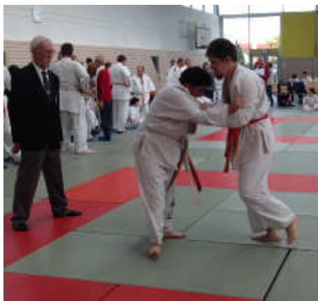
Sandro beim Wettkampf.

Mit einem Zitat von Nelson Mandela, dass Menschen durch die Überwindung von Angst über das Messbare hinaus kraftvoll