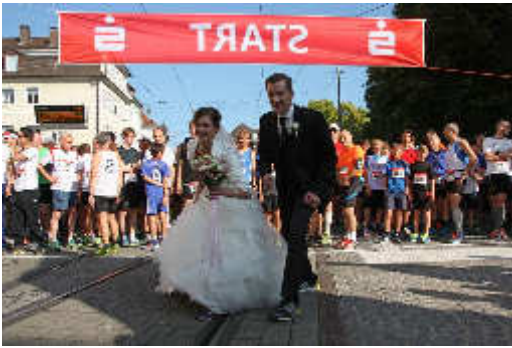
Start ins Eheglück mit Laufschuhen vor der Trauung in der Karlsburg