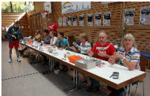
Ruhe vor dem Sturm: der Anmeldetisch