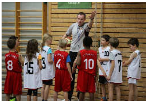
Der Schiedsrichter, dein Freund und Helfer