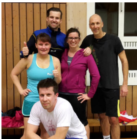
Ein Teil der Functional-Fitness-Gruppe

in der Friedrich Realschule / Sporthalle.