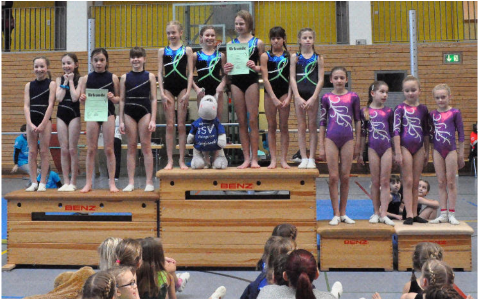
Am Ende der dritte Platz