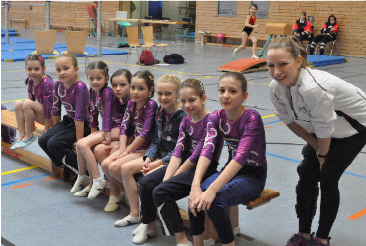
Aufregung, bevor es los geht.

Das Wettkampfsjahr für die Turnerinnen der Turnerschaft Durlach hat wie in jedem Jahr in Bretten begonnen.