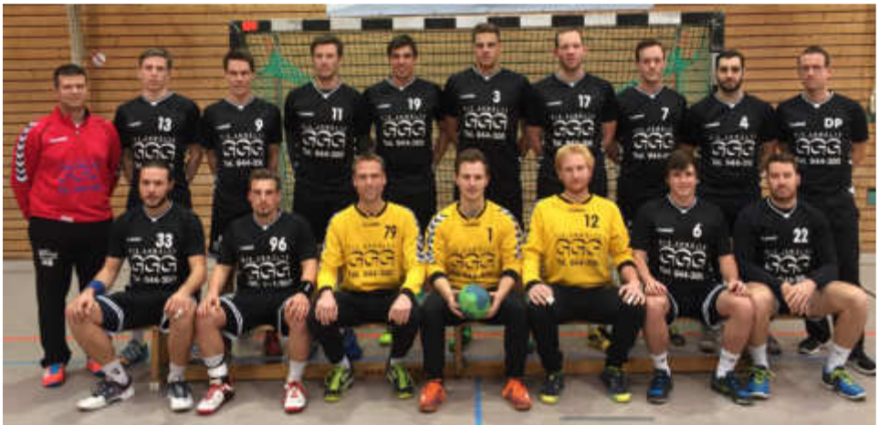
Die neue 1. Herrenmannschaft mit vielen Eigen gewachsen: Foto: Albus