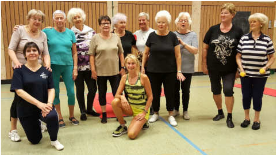
Der Gesundheitssport am Mittwoch macht Spaß, steigert die Beweglichkeit und das Wohlfühl.