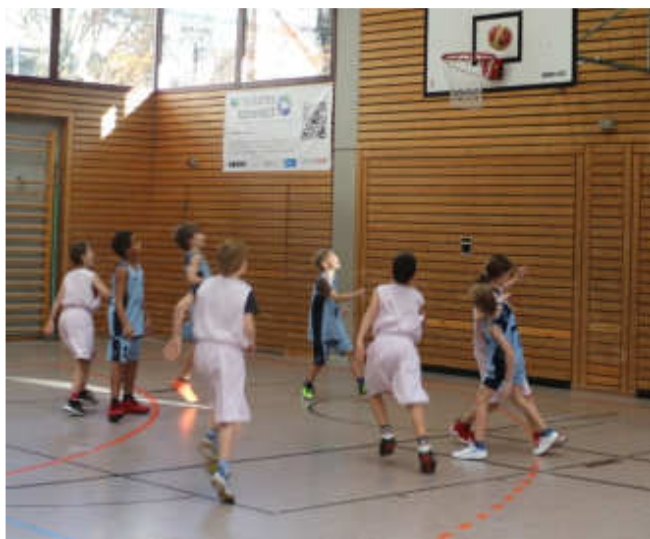
Die U10/11 II gegen SG EK Karlsruhe

Die Turnierserie der jüngeren Bambini ( U8/9 ) beginnt nach den Weihnachtsferien am 15. Januar in der Weiherhofhalle, und wir werden gerüstet sein für die nächste Wuselei.