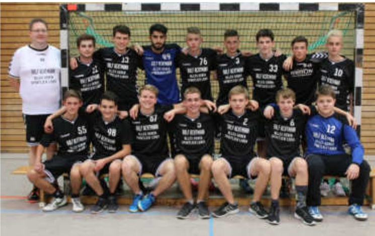
Die A-Jugend bei der Mannschaftsvorstellung.