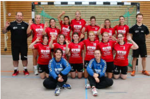
Ausgezeichnete Damen freuen sich auf eine erfolgreiche Saison.