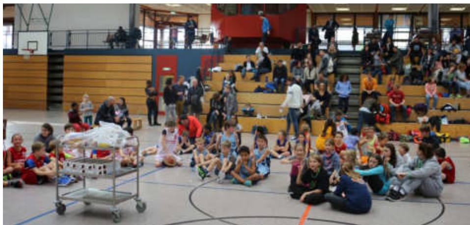
U10/11 vor der Siegerehrung beim Herbstturnier in der Weiherhofhalle