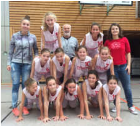
U13 weiblich beim Season Opening.

Die ersten Kraftakte mit Weinmarkt, Turmberglauf, Season Opening der U12/13 und Turnier der U10/11 sind gestemmt. Wengleich es immer so aussieht, als ob es bei der Unterstützung sehr eng werden würde, kommen dann doch immer die nötigen Helfer zusammen und tragen zum Gelingen der Ereignisse bei. Hierzu auch ein besonderes Dankeschön an die Spielereltern für das tatkräftige Anpacken und die Kuchenspenden.