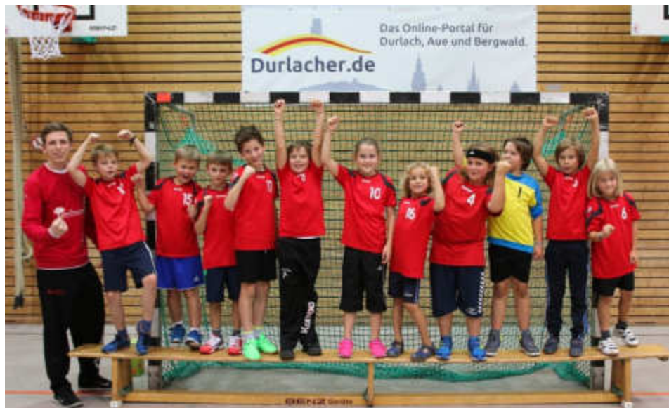
Die gemischte E-Jugend bei der Saisonöffnung.

Die neuformierten Teams der Turnerschaft sorgen in ihren Spielklassen nach knapp einem Drittel der Saison für Furore. Fast alle Teams sind gut aus den Startlöchern gekommen und zeigen, dass man in diesem Jahr mit ihnen rechnen kann.