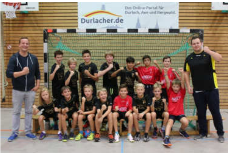
Die männliche D-Jugend freut sich auf eine erfolgreiche Saison.