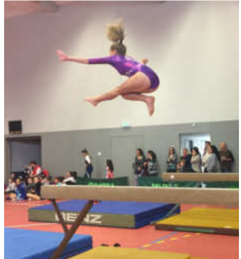
Maya hoch über dem Balken.

Am 29. Oktober 2016 wurden in Knielingen die diesjährigen Gaueinzelmeisterschaften der Kür Modifiziert des Karlsruher Turngaus ausgetragen.