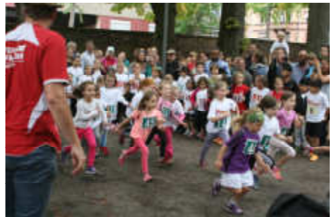
Mit Feuereifer auf die Strecke: Mädchen und Jungen der jüngsten Altersgruppe beim Kinderlauf.

Die ersten Laufentscheidungen fielen jedoch im Durlacher Schlossgarten. Dort liefen 280 Kinder in verschiedenen Altersgruppen zwischen 5 und 13 Jahren eine bzw. zwei Runden von je 400 Metern. Dank der guten Vorbereitung in den örtlichen Kindergärten und Grundschulen wurde mit großer Begeisterung um die besten Plätze gekämpft; nach jedem Lauf gab es dann im Ziel eine Medaille für alle und für die drei Besten wie immer Gold, Silber und Bronze.