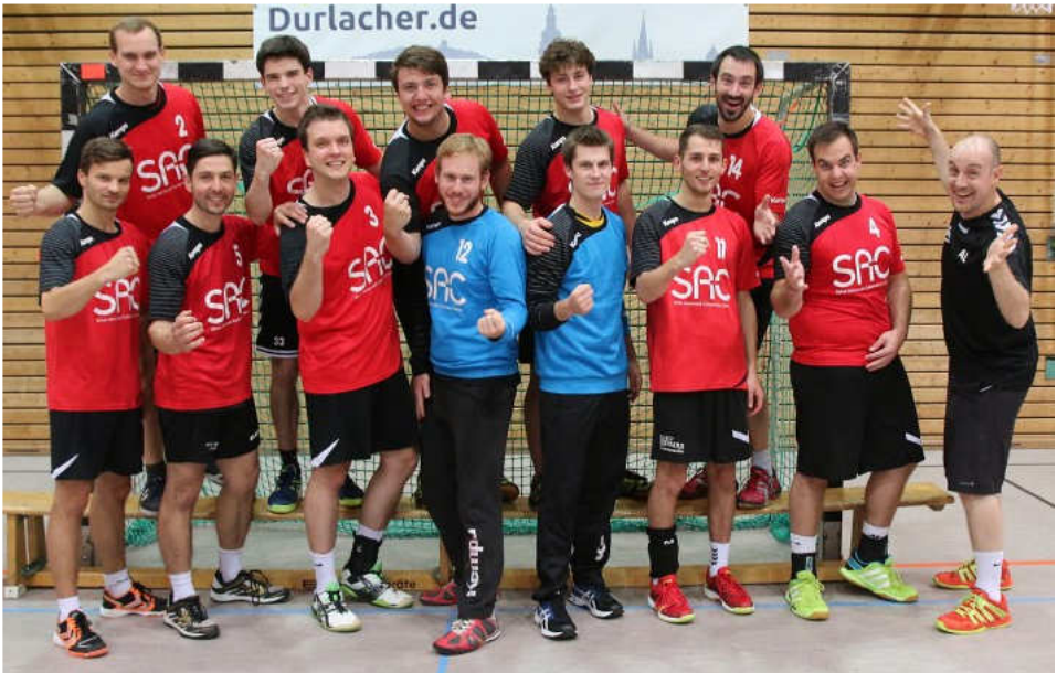
Die Durlacher Zweite freut sich auf eine erfolgreiche Saison.

Die Herren 3 mit Trainer Axel Dorn stehen vor einer schweren Saison. Nach dem Umbruch in der Ersten und Zweiten sind viele Spieler aus der Talentschmiede aufgerückt und verstärken dort die Mannschaften. Nach anfänglichen Schwierigkeiten konnte man zuletzt gegen die Teams aus Malsch und Ettlingenweier punkten und sich so ein kleines Polster erspielen. Nach drei erfolgreichen Spielzeiten mit Meisterschaften und Aufstieg eine neue Situation für die Mannen der Dritten.