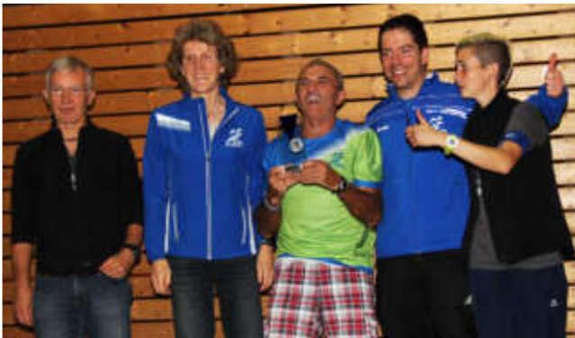
Mitglieder der LSG Karlsruhe freuen sich riesig über den Gewinn des Pokals für die größte Mannschaft.