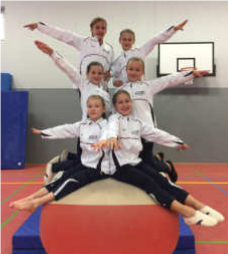
Teamfoto auf dem Sprungtisch.