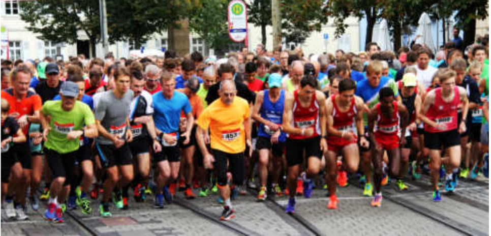
Start zum Turmberglauf 2016.

Am 1. Oktober 2016 veranstaltete der Lauftreff der Turnerschaft Durlach zum 24. Mal den Durlacher Turmberglauf. Bei schönem Spätsommerwetter kamen über 600 Läuferinnen und Läufer nach Durlach, um die 10km-Strecke in und um Durlach in Angriff zu nehmen. Traditionell hatten sich auch wieder viele Zuschauer in der Altstadt und entlang der Pfingz eingefunden, um die Läufer bei Start und Ziel sowie einigen weiteren Streckenpunkten stürmisch anzufeuern.