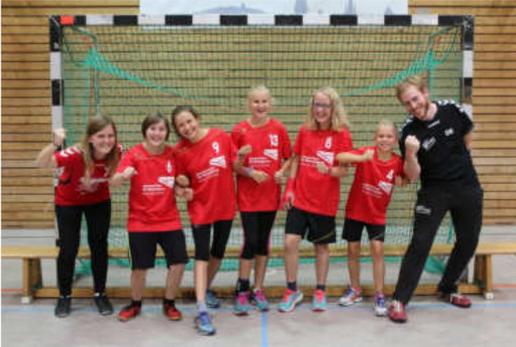
Die Mädels der D-Jugend suchen dringend Verstärkung.

arbeiten 2x die Woche mit einer großen Horde junger Handballer an deren individueller und mannschaftlicher Entwicklung. Das Team ist mittlerweile so stark gewachsen, dass man dringend mehr Platz in der Trainingshalle bräuchte, um mit der Entwicklung Schritt zu halten.