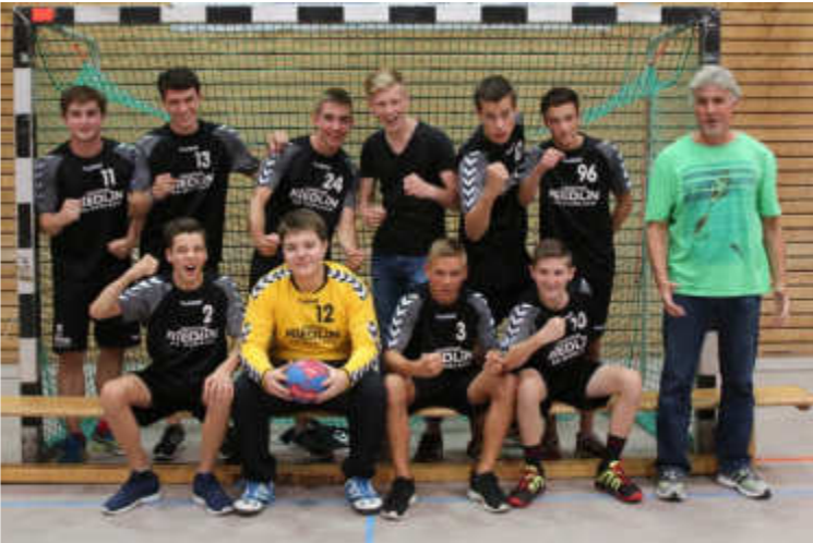
Der Tabellenführer der Landesliga-Süd nach acht Spieltagen.

Bei der männlichen A-Jugend läuft es ebenfalls gut. Trotz vermeidbarer Niederlagen gegen die beiden Teams aus Langensteinbach und Neuthard/Büchenau ist man nach sieben Spieltagen noch in Schlagdistanz zur Tabellenspitze. Vor der langen Winterpause im Dezember können die Jungs der Trainer Kai Albus und Robin Schneider bis auf 2 Punkte an die Tabellenspitze heranrücken.