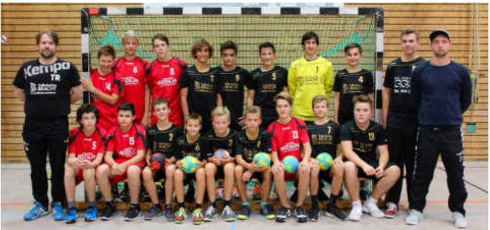
Die beiden C-Jugend-Teams bei der Saisonöffnung.