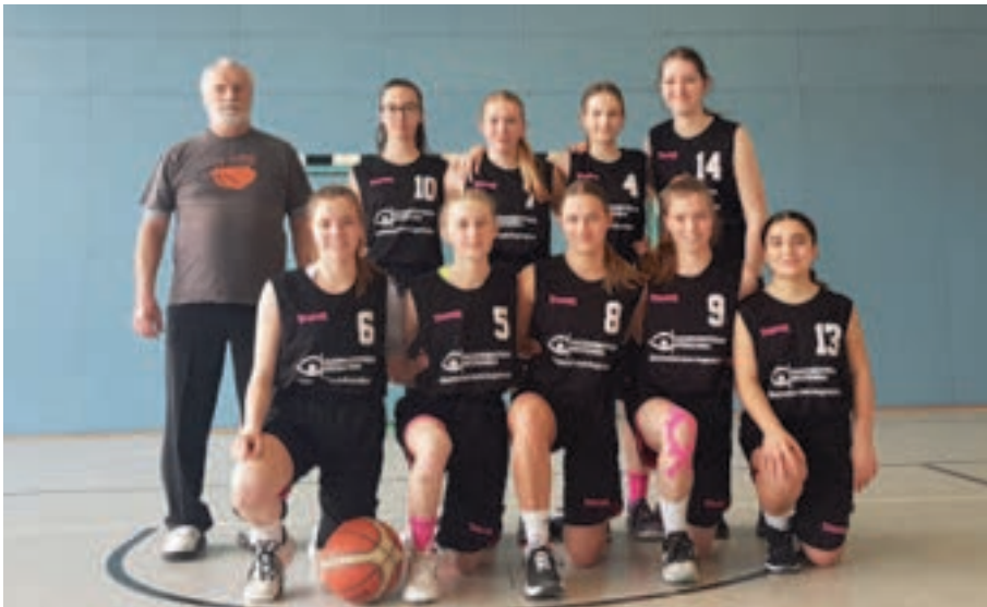
Klarer Tabellenführer und bereits Bezirksmeister: Die U18 der TSD spielt im weiteren Saisonverlauf um die baden-württembergische Meisterschaft.

Leider ließ bei der U16 die Trainingsbeteiligung und der Fortschritt der Spieler zur Winterpause hin nach. Die Trainer entschieden sich daraufhin für eine verstärkte Arbeit an den Grundlagen,