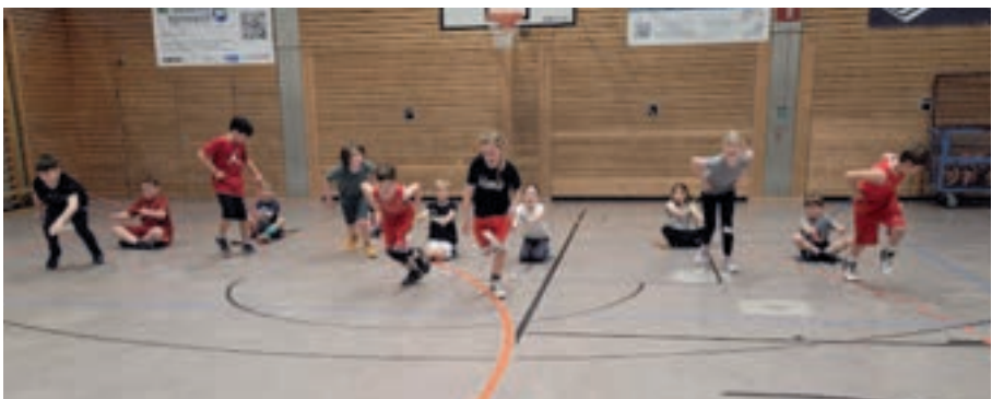
In der U10 geht es in erster Linie darum, den Zusammenhalt und Grundelemente wie Fitness und Konzentration zu fördern.

Die Mädchen starten in der Kreisliga A und können auf den augenblicklichen dritten Platz stolz sein. Immerhin haben sie sich in ihrer Liga auch gegen einige reine Jungenteams durchsetzen können. Sie haben sich bereits schon jetzt für die Bezirksmeisterschaft der Mädchen