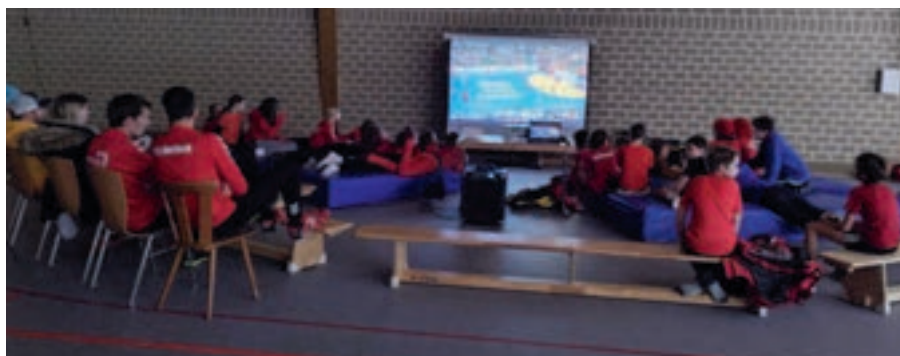
Der Zusammenhalt bei den Handballer:innen stimmt: Gemeinsames Handballschauen wie bei der Weltmeisterschaft darf da nicht fehlen.

In der mD1 besteht ein guter Mix aus den beiden Jahrgängen. Das Team misst sich mit den stärksten Gegnern in der Landesliga, der höchstmöglichen D-