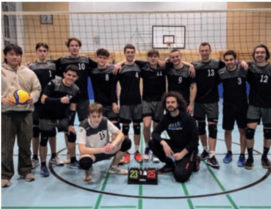
Die Lernkurve der zur Saison neugegründeten Herrenmannschaft zeigt steil nach oben. Das belegt auch Platz sechs in der Bezirksklasse.

Neben einem rein pragmatischen Aspekt, der Finanzierung von Volleybalausrüstung, steht der Spaß an