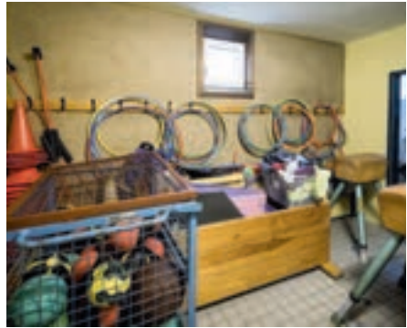
Die Materialanlieferung (oben) macht deutlich, wie groß das "Projekt Hallenboden" ist. Unterstützung erhalten wir durch die Handballabteilung, die tatkräftig mithilft und etwa die Sockelleisten abmontiert (links), die Halle ausräumt und viele Sportgeräte in den Umkleiden parkt (rechts).

Dankeschön wird nach der Finanzierungsaktion neben einer Unterstützertafel im Foyerbereich der Halle ein Banner mit allen Namen der Unterstützer aufgehängt.