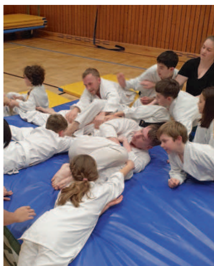
Das Miteinander darf nicht fehlen: Egal ob bei der Ü40-Gruppe (oben), beim Abendvesper (links) oder bei lustigen Warmmachspielchen.