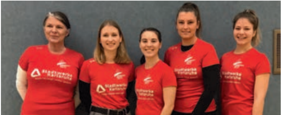
Sportlich und einheitlich unterwegs: Die Übungsleiterinnen der Turnabteilung sind ab sofort farblich zu erkennen - sowohl die Trainerinnen der Kleinkindergruppen als auch die die der Leistungsriege.