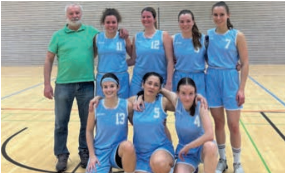
Trotz etlicher Personalwechsel präsentiert sich die zweite Frauenmannschaft in der Landesliga stark. Für den Aufstieg wird es aber nicht reichen.

Bei den Männern 2 lautet das Motto eher „dabei sein ist alles“, denn bislang stehen erst zwei Siege auf der Habenseite in der Kreisliga B. Aber das Team hat Spaß am Spiel und kämpft um jeden Punkt.