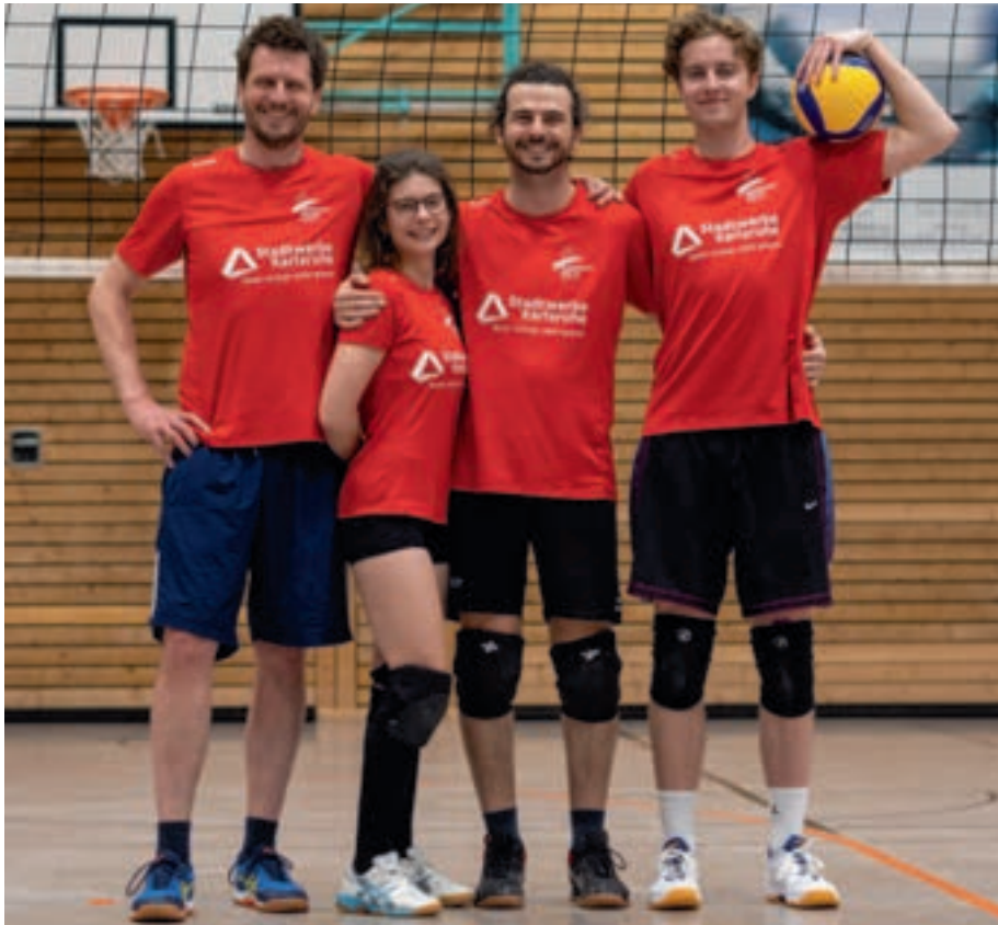
Auch die Übungsleiter:innen der Volleyballabteilung durften sich über die knallroten neuen Vereinsshirts freuen.