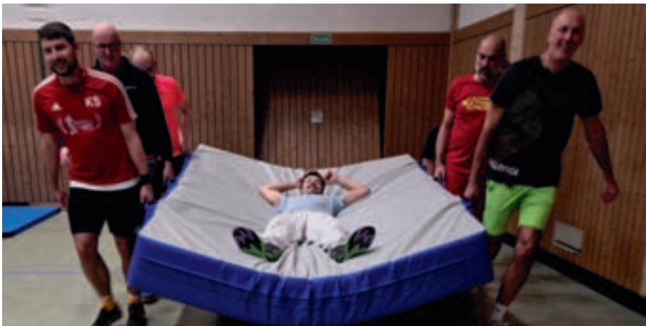
In der Fitness- und Gesundheitsabteilung der TSD geht es nicht nur um das Sporttreiben, sondern auch um die soziale Komponente.

All die aufgezählten Punkte lernen wir nach der schwierigen Corona-Phase jetzt aufs Neue schätzen. Unsere Angebote boomen, jede Woche tummeln sich eine Menge von sportinteressierten Menschen bei uns. Egal ob Jung oder Alt, bei uns findet jeder und jede ihre sportliche Herausforderung. (Lawrence Lawniczak)