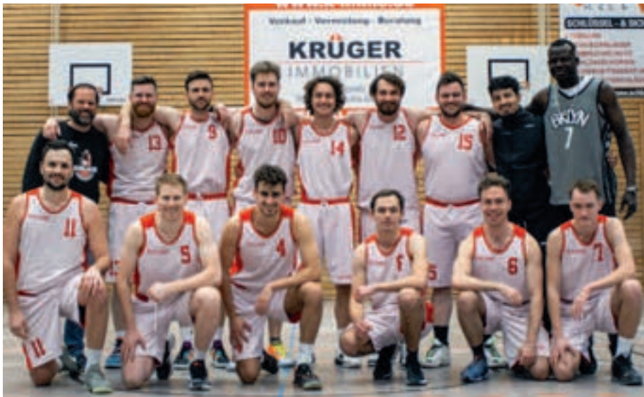
Haben einen Lauf: Die Herren 1 spielen in der Bezirksklasse eine starke Runde und könnten am Ende in die Bezirksliga aufsteigen.

Deutlich spannender ging es dann in Pforzheim zu. Gegen die Goldstadt Baskets erkämpften sich die Durlacher die einzige und letztlich entscheidende Führung im Spiel fünf Sekunden vor Schluss, obwohl die TSD drei Minuten vor Schluss noch mit elf Punkten in Rückstand lag. Durch großen Einsatz in den