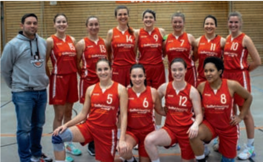
Die Entscheidung, ob die Frauen 1 absteigen, könnte am letzten Spieltag fallen. Nach Startschwierigkeiten zu Saisonbeginn hat sich das Team gefangen.

Die Regionalligamannschaft steckt in der erwarteten schwierigen zweiten Saison. Die Hinrunde verlief enttäuschend, teilweise gingen Spiele sehr deutlich verloren. Verantwortlich dafür waren neben Verletzungs- und Krankheitspech