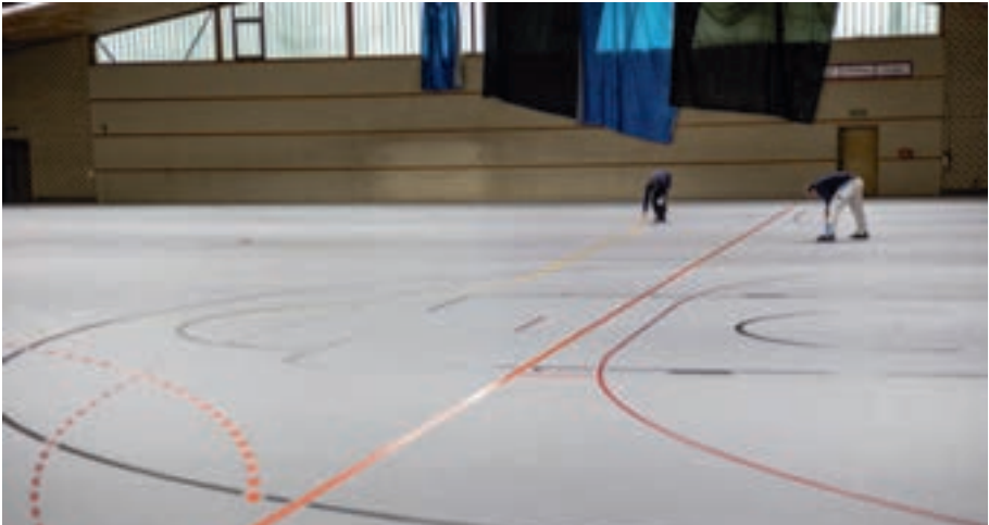
Fingerspitzengefühl und Genauigkeit waren beim Auftragen der Spielfeldmarkierungen in der Unteren Hub gefragt.

Einen Ausweg daraus versprechen wir uns von der Realisierung des geplanten Sport-