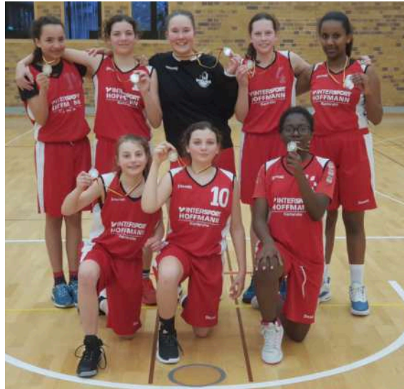
Die stolzen Vizemeisterinnen der Durlacher U14 Mannschaft.

Erfreulich verläuft die Spielzeit bei den beiden U12-Mannschaften, die beide in der Kreisliga A mixed antreten. Die