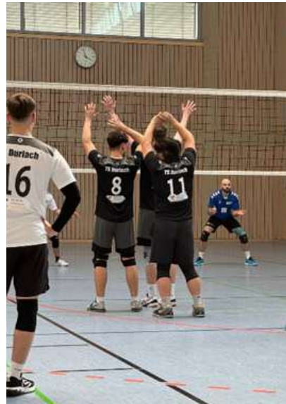
Die Herren 1 in Aktion.

Vergangenen März hatte die (mehrheitlich junge) Herrenmannschaft die Möglichkeit, gegen (mehrheitlich junggebliebene) ehemalige Spieler und Trainer der TS Durlach spielen zu dürfen. Eine handverlesene Auswahl an Ehemaligen hat sich hierbei organisiert, um gegen das Bezirksklasse Team ein Trainingsspiel veranstalten zu können. Es war ein toller Volleyball-Abend mit der Möglichkeit, Akteure vergangener