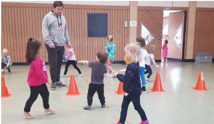
Die neue Ballschule der TSD: Hier können sich schon die Kleinsten am Ball ausprobieren.

Ballschule für die Kleinsten eingerichtet