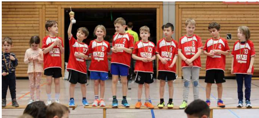
Glückliche Kinderaugen beim F-Jugend-Turnier in der Weiherhofhalle.

Die Saison 2023/24 ist vorbei und die Handballabteilung der TSD schaut auf eine ereignisreiche Saison zurück. Während die aktiven Mannschaften, auch aufgrund einiger schwererer Verletzungen, teils unter den eigenen Zielen und Erwartungen zurückblieben, konnten sich die Kinder und Jugendlichen in den verschiedenen Altersklassen weiterentwickeln und wertvolle Erfahrungen auch in höheren Ligen sammeln. Zudem sind die Qualifikationsturniere der Jugendmannschaften für die neue Runde bereits gestartet und es konnten erste Erfolge gefeiert werden.