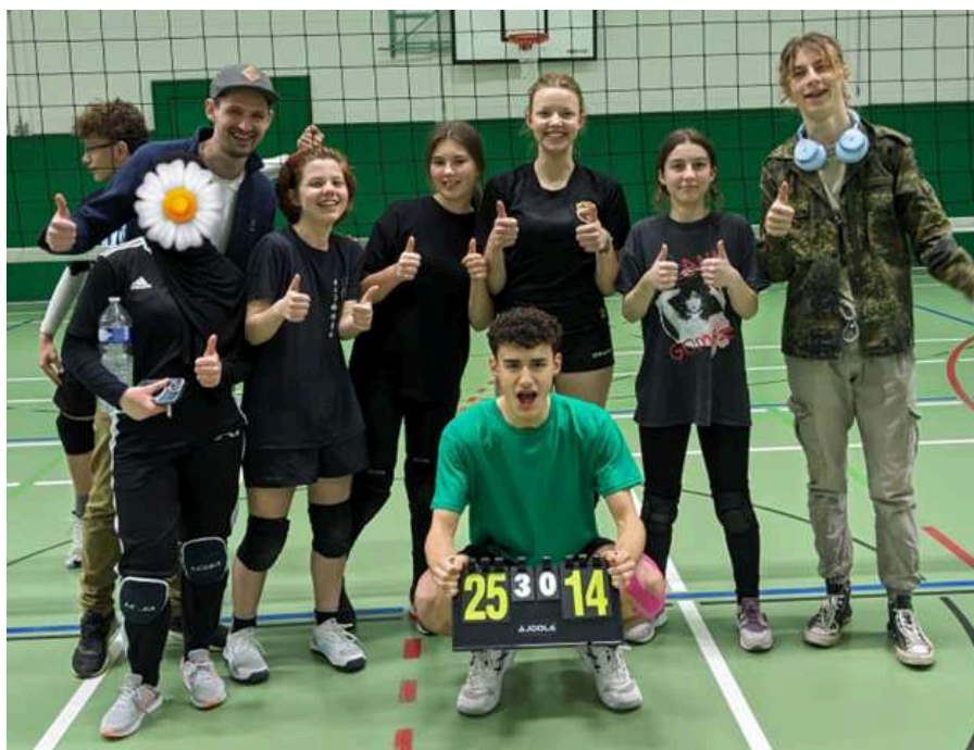
Die bunte Truppe der U15 Spielerinnen und Spieler mit viel Freude am Volleyballsport.

Volleyball ist eine sehr schwere Sportart, weshalb es am Anfang demotivierend sein kann. Aber wenn man dranbleibt, lohnt es sich garantiert. Sobald man die Grundlagen kann, existieren grenzenlose Möglichkeiten, wie man mit seinem Team zaubern kann, deswegen ist es in meinen Augen auch eine der schönsten Sportarten.