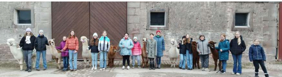
Auch außerhalb der Sporthalle ist Teambuilding möglich. Hier die weibliche D-Jugend bei einer gemeinsamen Alpakawanderung.

Für die Jungs der mC verlief die Landesligasaison 2023/ 24 super erfolgreich. Man musste über die komplette Runde nur drei Niederlagen verkraften und diese waren gegen die Reserven der