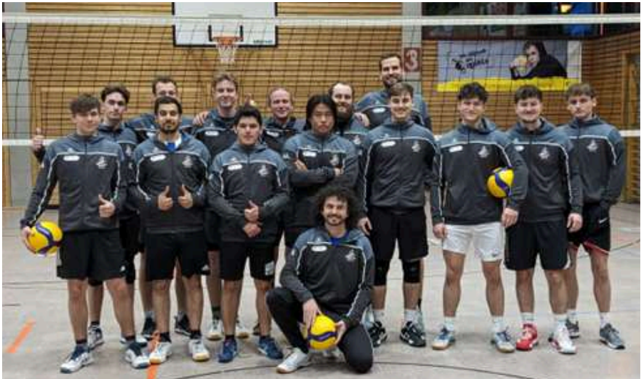
Die Mannschaft Herren 1 beendet die Saison 23/24 trotz zahlreicher verletzungsbedingter Ausfälle erfolgreich.