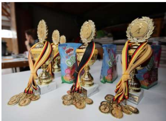
Motivation für kleine Sportlerinnen und Sportler: Medaillen und Pokale.