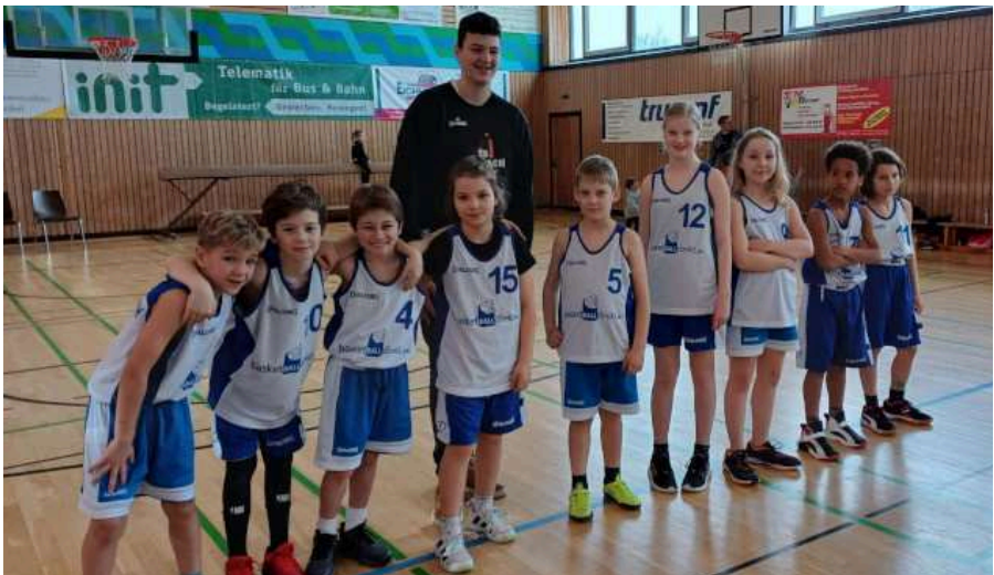
Schon die Kleinen präsentieren sich ganz groß: die U10 mixed Mannschaft steigt erfolgreich in den Ballsport ein.

Ch. Paeffgen/S.Kopp/T. Fritzen/ M. Kullmann/F. Seyboth/ H. Umfahrer