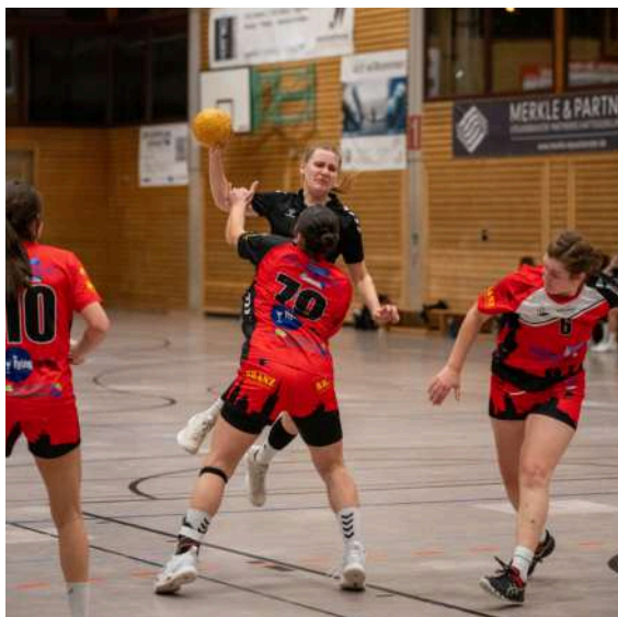
Die Damen gaben wieder Vollgas.

Bereits vor dem letzten Saisonspiel der Damen steht fest, dass sie auch diese Landesliga Saison wieder auf dem 5. Platz beenden werden. Der Platz