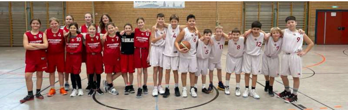
Erfolgreiche Teams: Die U12-Mannschaften der TSD.

Jungenmannschaft kommt nach etwas holprigem Beginn immer besser ins Spiel und belegt derzeit den 2. Tabellenrang, die Mädchen stehen auf dem 4. Rang. Sie haben noch die Chance, sich für die